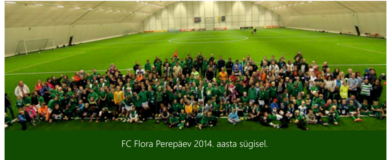
FC Flora Perepäev 2014. aasta sügisel.

FC Flora noortegruppides treenivate laste vanemaid võõrustab kodumängudel FC Flora Family Lounge ning esindusmeeskonna mängijad külastavad regulaarselt FC Flora noortetreeninguid.