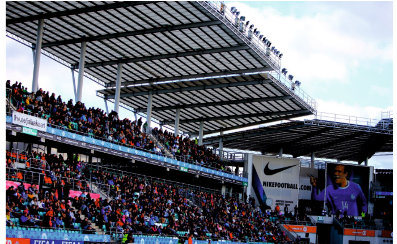
2610 inimest: publikuarv FC Flora - Nõmme Kalju kohtumisel 27.septembril 2014