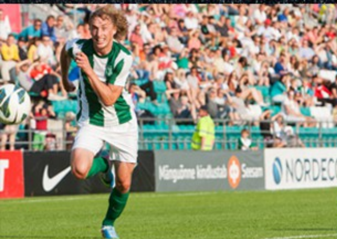
A.LE COQ ARENA

Suuremõõduliste bännerite eksponeerimise võimalus FC Flora treeningkeskuses (2 täismõõdmetes muruväljakut)